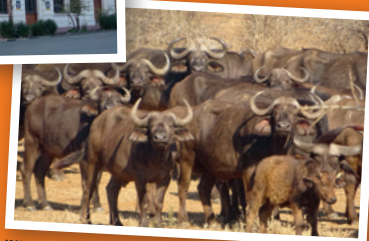
WILLKOMMEN IM BUSCH!